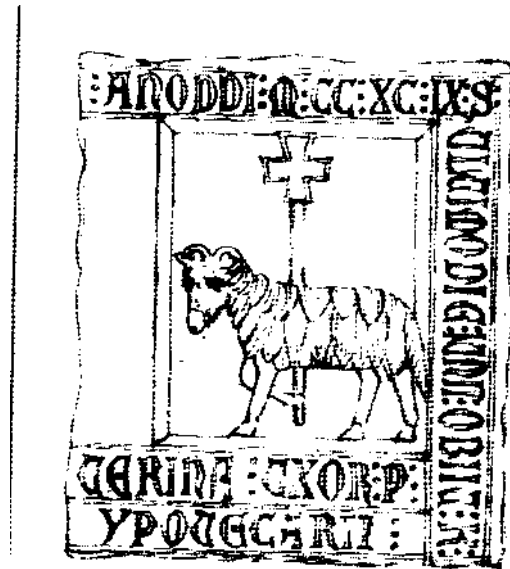
Pierre funéraire qui se trouvait à Cabrières