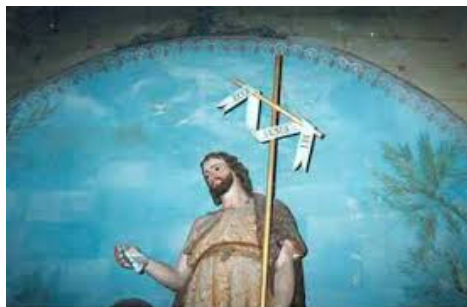
« Ecce agnus Dei »