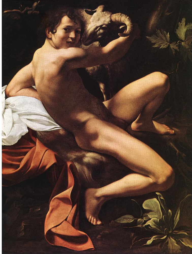
Jean le Baptiste et l'agneau de Dieu (Musée du Capitole à Rome).

Cependant, dans un tableau qui a été authentifié et qui a été peint vers 1602, le peintre Caravage a représenté l'agneau de Dieu sous la forme d'un bélier reconnaissable à ses cornes.