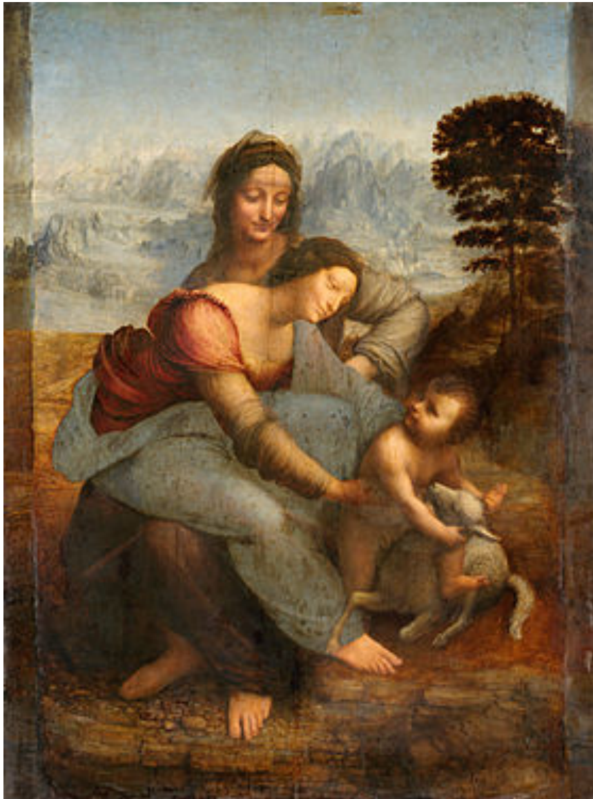
« La Vierge, l'enfant Jésus et Sainte Anne » (Louvre).

Ces deux œuvres de peintres célèbres transmettent le Grand Secret :