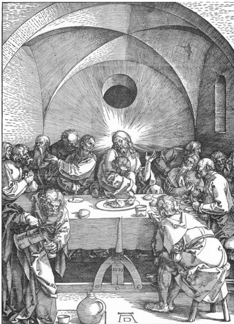
La Cène par Dürer (Pied de la table en forme de rapporteur)

Nous retrouvons donc l'emplacement du Dé signalant l'entrée du tombeau de Jésus-Christ Barabbas (sous le mont Cardou) décalée de trois degrés par rapport à l'aplomb du tombeau situé sur l'angle inversé de 151° indiqué à la fois par le verset 1.51 de Luc, la Cène (gravure) de Dürer et le plan caché dans la stèle de Marie de Nègre d'Ablès dernière châtelaine de Rennes-le-Château.