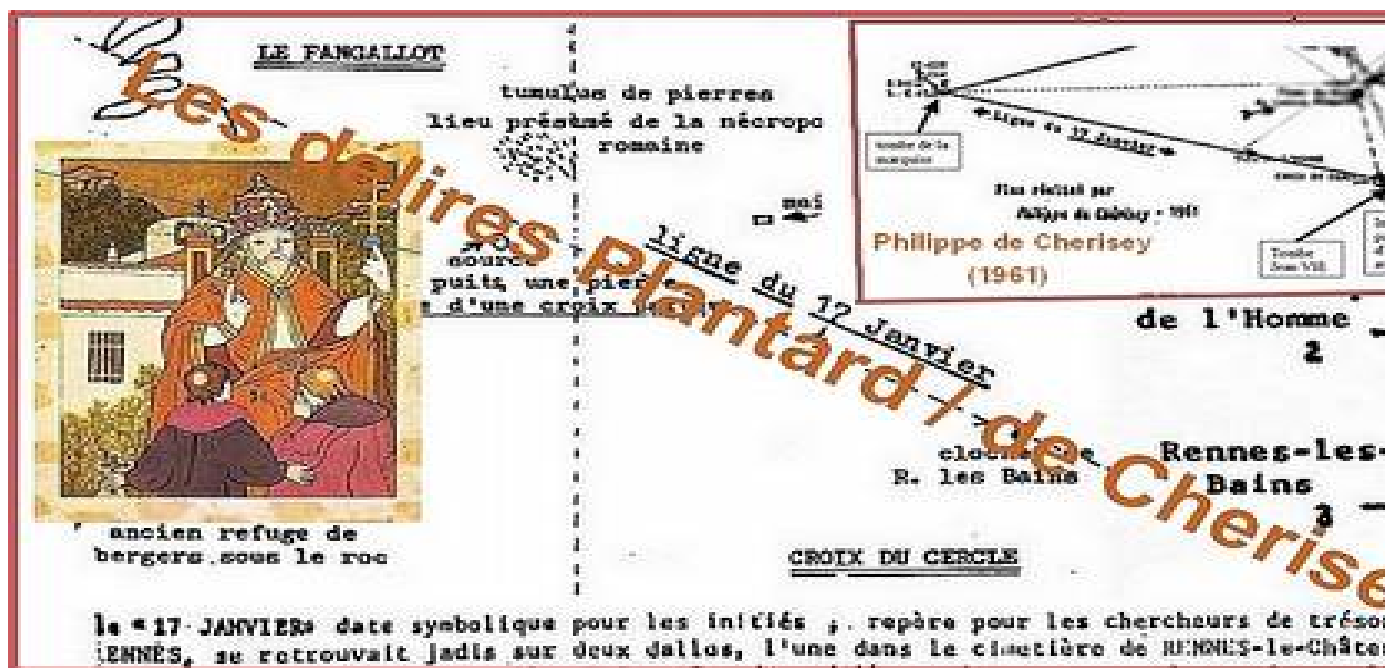
Document Franck Daffos découvert par Brunelin à la BN