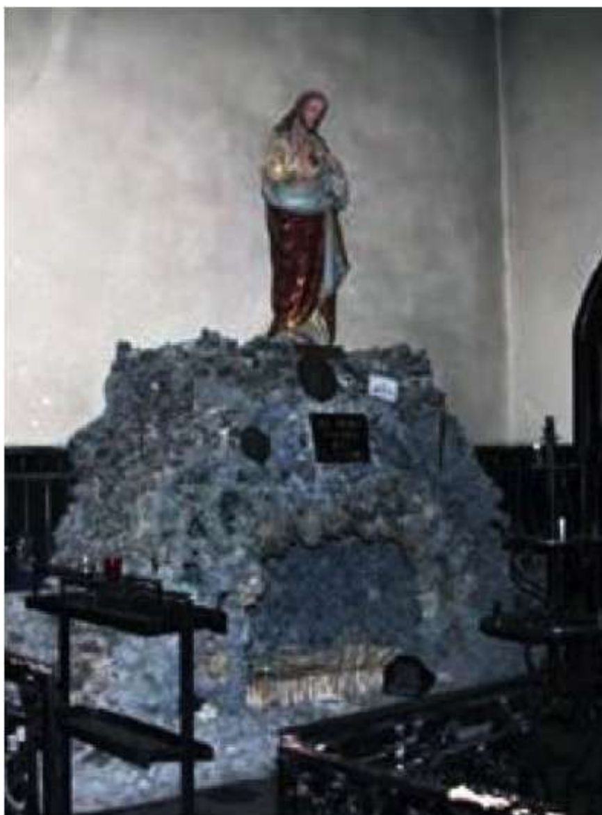
Eglise d'Espéraza : noter les 2 Jésus dans la grotte et sur la grotte

Non seulement nous retrouvons les 2 Jésus dans les bras de Joseph et de Marie, mais l'abbé Rivière a construit une grotte miniature de plus d'un mètre de haut en guise de station 14, dans laquelle il a placé un Jésus (En contradiction totale avec le dogme de l'Ascension) allongé et sur le plafond de laquelle nous pouvions observer la statue d'un deuxième Jésus debout et bien vivant !