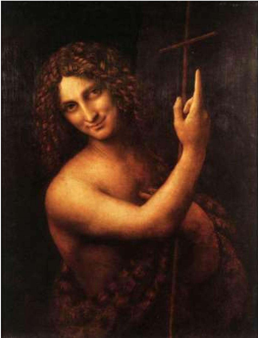
Jean le Baptiste – Léonard de Vinci - Louvre

Son corps est peint en jaune sur fond obscur pour exprimer qu'autour de lui règnent les ténèbres et qu'il est la lumière du Monde (Confer Codex Bezae Luc 1.79)