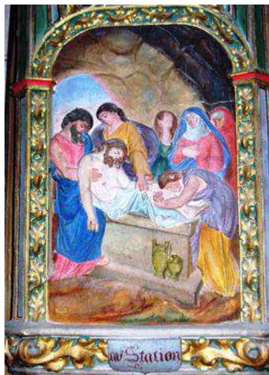
Station 14 du chemin de croix : le Christ en rouge et bleu porte le crucifié !