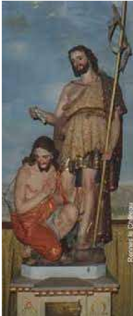
Les deux Messies : baptistère de l'église de Rennes-le-Château

Si nous observons attentivement le baptistère situé face à l'entrée de l'église, nous remarquons que les barbes du Christ et de Jean le Baptiste sont taillées en forme de W qui est un M retourné, initiale de Messie (rappelant la Cène de Vinci).