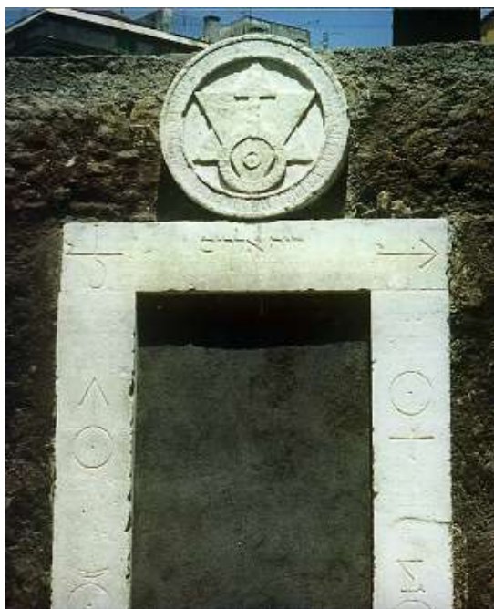
Porte alchimique de l'Académie de l'Arcade (Rome)

L'abbé Saunière a laissé à la postérité un dernier message venu d'outre-tombe, en y faisant graver une croix avec un N inversé.